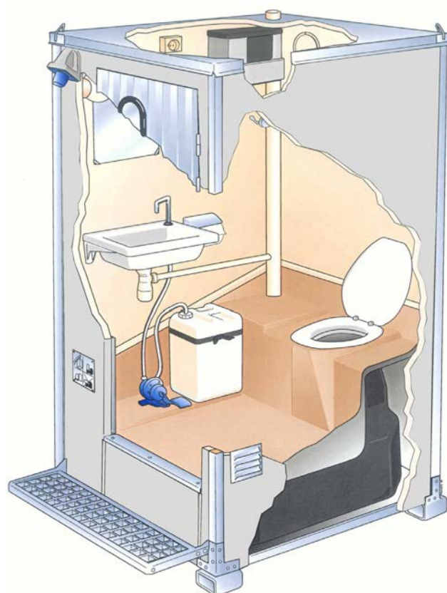
Genomsnitt av en T-500.

Alla enheter är lätta att flytta och transportera. Kabinerna kan användas permanent eller periodvis på till exempel golfbanor, campingplatser och arbetsplatser inom bygg- och tillverkningsindustrin.